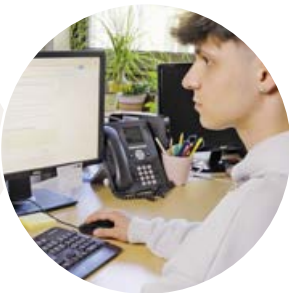
Applikations- entwickler:in/ Coding

Erhältst du eine Zusage, dann hast du es geschafft! Du startest deine Topausbildung beim Bund.